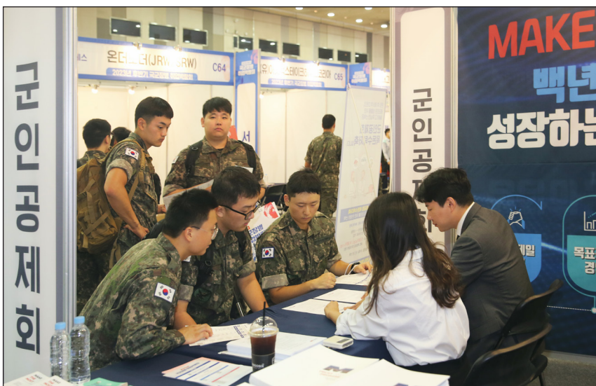
국군장병 취업박람회에 참석한 장병들이 군인공제회 부스에 방문해 취업 컨설팅을 받고 있다.

군인공제회(이사장 정재관)는 지난 9월 13~14일, 일산 킨텍스에서 개최된 ‘2023년도 하반기 국군장병 취업박람회’를 후원하고, 장병들을 위한 취업·재테크 노하우를 안내했다. 국군장병 취업박람회는 국가에 헌신한 국군장병의 취업 역량을 강화하고, 우수 기업과의 매칭을 통해 전역 예정 장병의 안정적인 사회 정착을 지원하는 ‘취업의 장’이다.